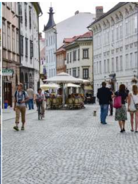
Trg Ćirila i Metodija